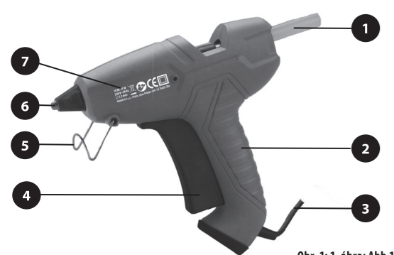
Obr. 1; 1. ábra; Abb.1

Übersetzung der ursprünglichen Bedienungsanleitung